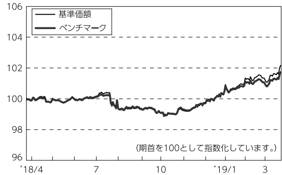
基準価額とベンチマーク（指数化）の推移