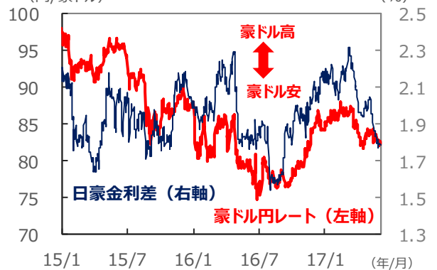
【豪ドル円レートと日豪金利差】

(注1) データは2015年1月2日～2017年6月6日。2017年6月6日は日本時間15時時点のレート。 (注2) 金利差は豪州－日本。金利はともに3年国債利回り。 (出所) Bloomberg L.P.のデータを基に三井住友アセットマネジメント作成