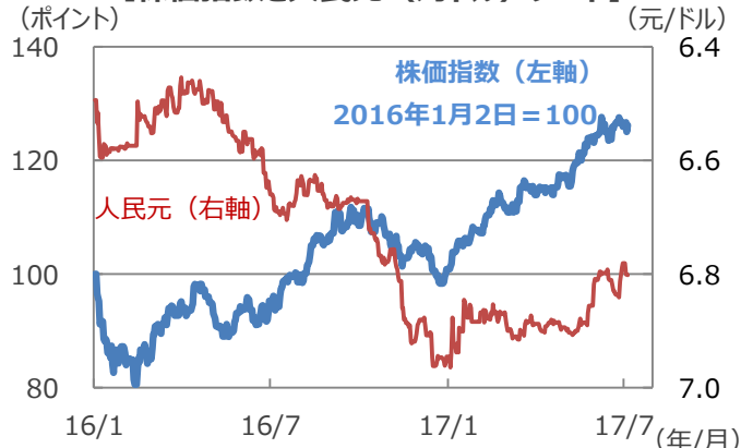
【株価指数と人民元（対ドル）レート】