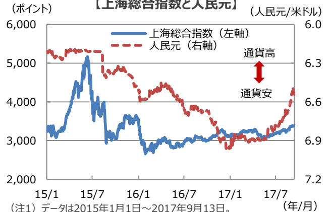
【上海総合指数と人民元】

(注1) データは2015年1月1日～2017年9月13日。 (注2) 人民元は逆目盛。