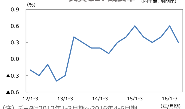
実質GDP成長率（四半期、前期比）

(注) データは2012年1-3月期～2016年4-6月期。 (出所) Bloomberg L.P. のデータを基に三井住友アセットマネジメント作成