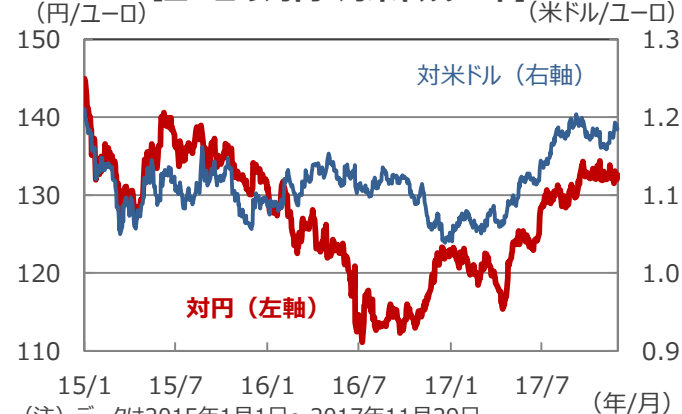
【ユーロの対円・対米ドルレート】

(注) データは2015年1月1日～2017年11月29日。 (出所) Bloomberg L.P. のデータを基に三井住友アセットマネジメント作成