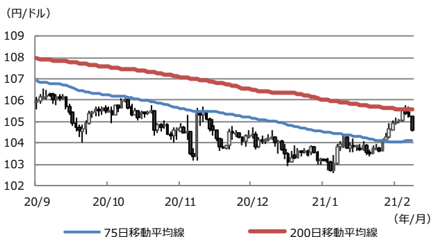
【図表1：ドル円相場と移動平均線】

(注) データは2020年9月1日から2021年2月9日。