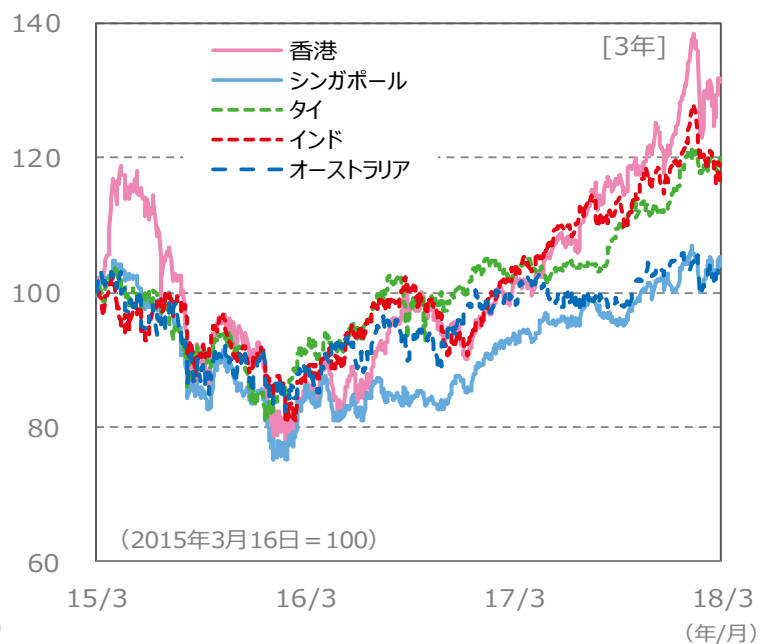
【国・地域別の株価指数の推移】 [3年]