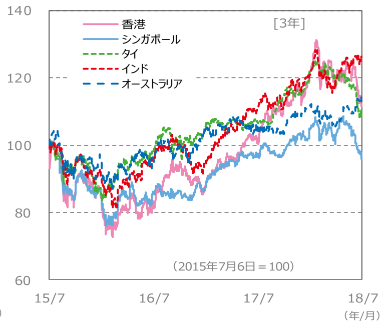
【国・地域別の株価指数の推移】 [3年]