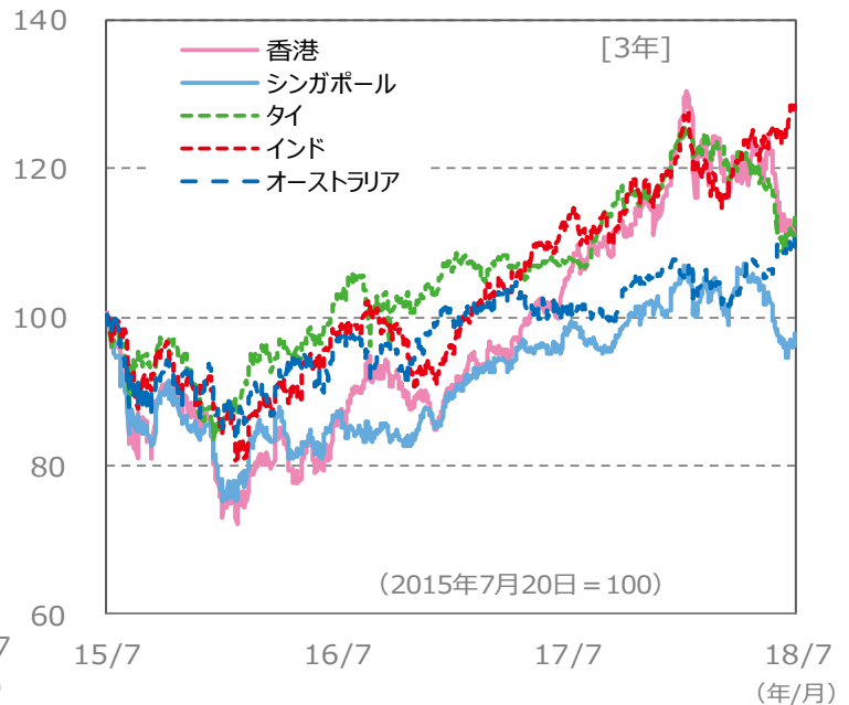
(ポイント) 【国・地域別の株価指数の推移】 [3年]