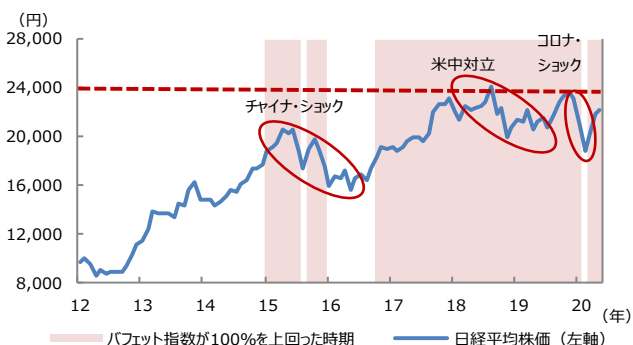
【図表2：バフェット指数と日経平均株価】

(注) データは2012年1月から2020年6月。バフェット指数は図表1の数値を使用。 (出所) 日本取引所グループ、Bloomberg L.P.のデータを基に三井住友DSアセットマネジメント作成