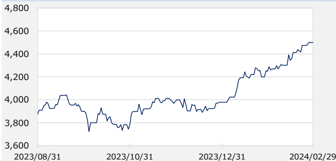
TOPIX（東証株価指数、配当込み）