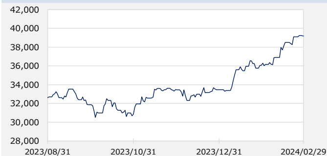
日経平均株価（日経225）（円）