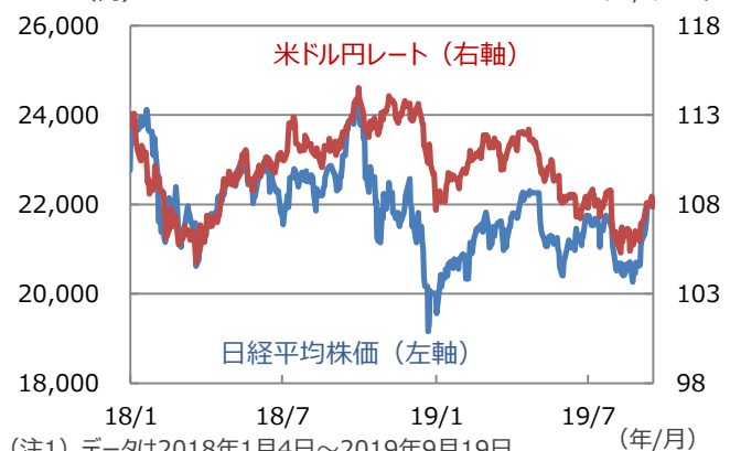
【ドル円レートと日経平均株価】(円/米ドル)