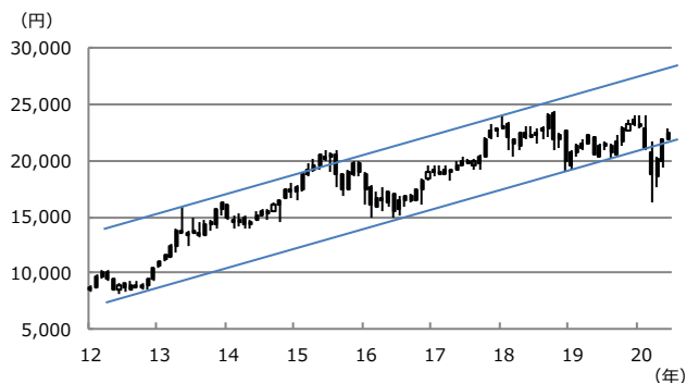
【図表1：日経平均株価の上昇トレンド】

(注) データは2012年1月から2020年6月。ローソク足は月足。ただし2020年6月は3日まで。上値抵抗線は2013年5月高値と2018年1月高値を結んだ線。下値支持線は2012年10月安値と2016年6月安値を結んだ線。