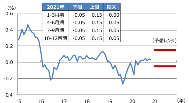
【図表2：日本10年国債利回りの予想レンジ】

(注) データは2015年1月から2020年11月。月末値を使用。2020年12月18日時点の三井住友DSアセットマネジメントによる予想。太線は予想レンジの上限と下限。