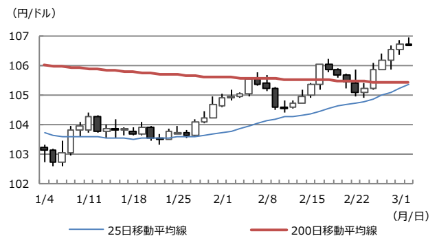
【図表2：ドル円相場と移動平均線】