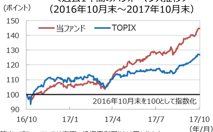
＜過去1年間のパフォーマンス推移＞ (2016年10月末～2017年10月末)

(注1)当ファンドのパフォーマンスは税引前分配金再投資基準価額を基に算出。パフォーマンスは実際の投資家利回りとは異なります。