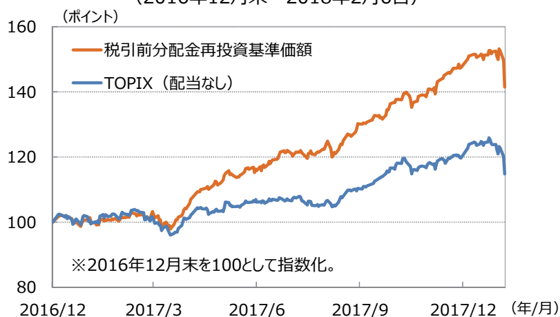
＜パフォーマンスの推移＞ (2016年12月末～2018年2月6日)

(注1) 税引前分配金再投資基準価額は1万口当たり、信託報酬控除後。税引前分配金再投資基準価額は、分配金（税引前）を分配時に再投資したものと仮定して計算しており、実際の基準価額とは異なります。